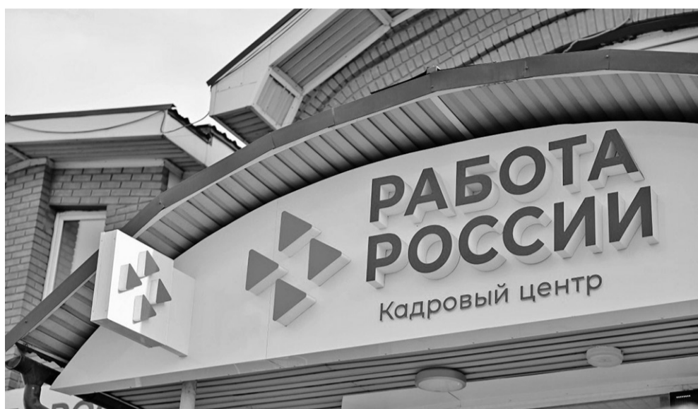
Отметим, получить консультации по организации предпринимательской деятельности можно во всех центрах занятости районов, городов республики.